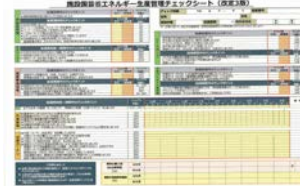
▲省エネチェックシート