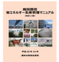
▲省エネマニュアル